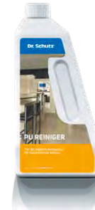
PU-Reiniger Nettoyant PU