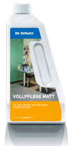
Vollpflege matt Polish mat

1000 ml 750 ml 750 ml 750 ml 19145 19148 19142 19143