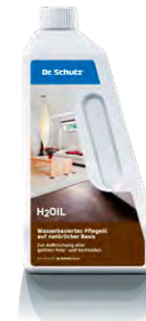
H 2 Oil Pflege Polish H 2 Oil