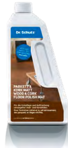
Parkett- & Kork Vollpflege matt Polish parquet & liège mat

Gebinde Bidon 750 ml 750 ml Art. Nr. Art. No. 19140 19141