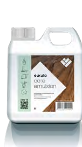
Eukula Care Reiniger Nettoyant Eukula Care

Avec le sol de Naturo.Swiss, vous obtenez un revêtement de qualité, robuste et d'une beauté intemporelle. Pour que votre sol ait toujours l'air neuf, nous vous recommandons, selon le revêtement, les produits de nettoyage et d'entretien correspondants, que vous pouvez acheter dans notre boutique en ligne.