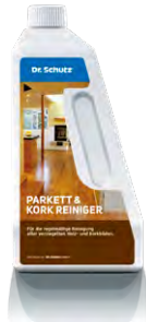
Parkett- & Korkreiniger Nettoyant parquet & liège

Mit dem Boden von Naturo.Swiss erhalten Sie einen hochwertigen, robusten und zeitlos schönen Bodenbelag. Damit Ihr Boden immer wie neu aussieht empfehlen wir Ihnen je nach Belag die entsprechenden Reinigungs- und Pflegemittel, die Sie in unserem Online-Shop beziehen können.